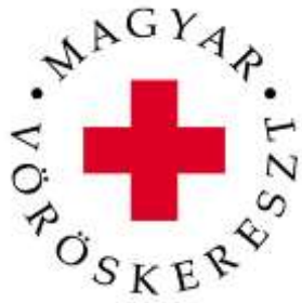
A Magyar Vöröskereszt Bázisiskolája