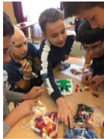
Legóval támogatott történetmesélés

Az idegen nyelvi kompetencia fejlesztése mellett nagy hangsúlyt fektetünk anyanyelvünk ápolására is. Ennek jegyében szerveztük meg több mint harminc alkalommal a területi Nagy László Szavalóversenyt. A művészet iránt érzékeny tanítványaink a Bíró Károly rajzversenyen, az iskolai kórusban valamint a Tarczy Gálán is kibontakoztathatják tehetségüket.