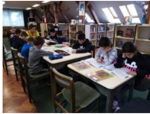
foglalkozás az iskola könyvtárában