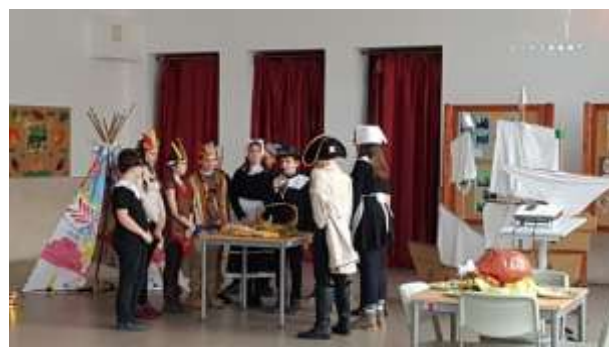
Thanksgiving Day - Hálaadás napi, angol nyelvű színdarab

Szoros szakmai kapcsolatot ápolunk közös programokat szervezünk a QSI amerikai iskola pápai tagintézményével és a Tapolcai Bárdos Lajos Általános Iskola Batsányi János Magyar - Angol Két Tanítási Nyelvű Tagintézményével.