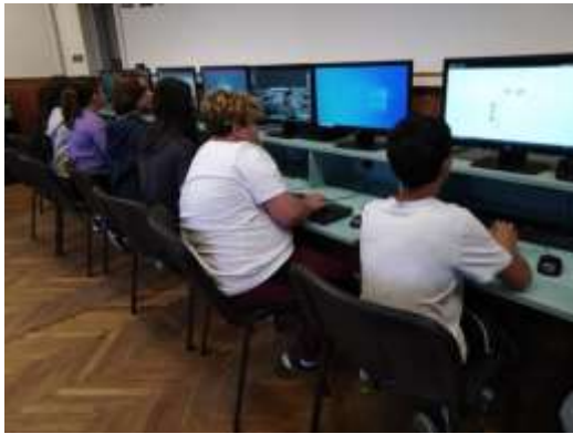
tanóra az informatika szaktanteremben