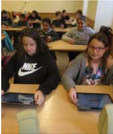
Digitális oktatás tantermen belül és kívül