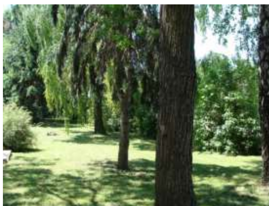
A Kossuth utcai főépület parkja.