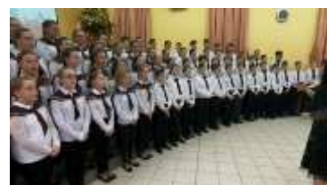
Minikórus: 1.-2. évfolyam